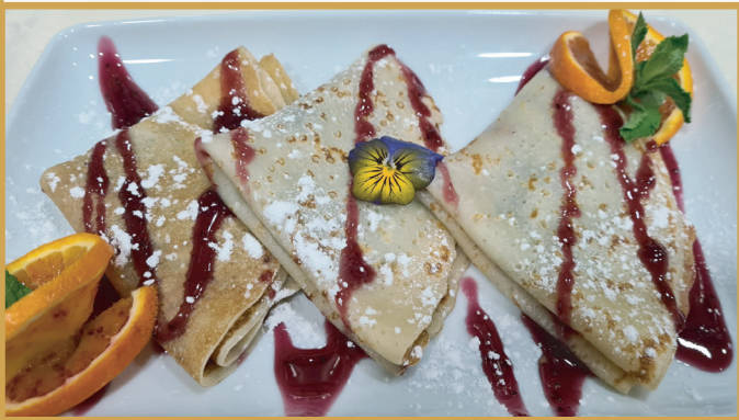
Clătite cu gem (clătite simple 1,3,7 , gem asortat de caise)

226.42 Kcal / 947.34 KJ per 100g 200 g 24 LEI