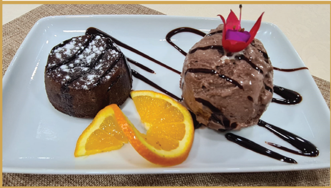
Lava Cake (Lava Cake, înghețată 7 )

233 Kcal / 974.87 KJ per 100g 250 g 28 LEI