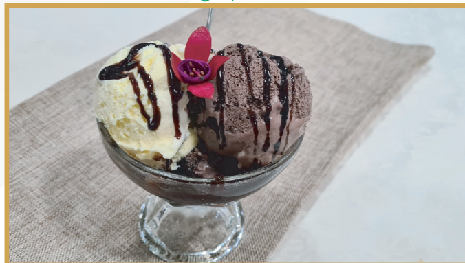
Înghețată de vanilie și ciocolată (înghețată 1,6,7 )

188.45 Kcal / 788.47 KJ per 100g 300 g 22 LEI