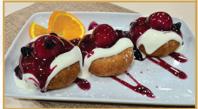
Papanași cu gem de afine, și sos de smântână dulce (papanași, zahăr, smântână 7 , gem fructe de pădure)

277.01 Kcal / 1159 KJ per 100g 250 g 28 LEI